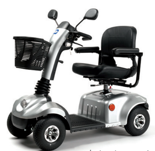
coloris gris argenté