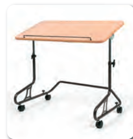
Table 378 disponible

Option: B12 - Tablette amovible, rabattable et réglable en profondeur (pour fauteuils taille 380 à 480 mm)