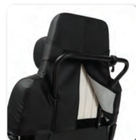
Les housses sont amovibles

Option: B12 - Tablette amovible, rabattable et réglable en profondeur (pour fauteuils taille 380 à 480 mm)