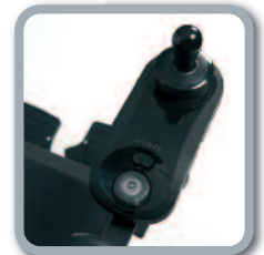
LE besturing - Enkel in basisuitvoering