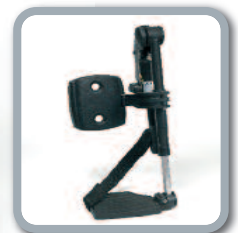
Optie : BZ7-E Elektronisch regelbare voetsteunen