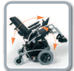
Elektrisch inclineerbare rug en zit