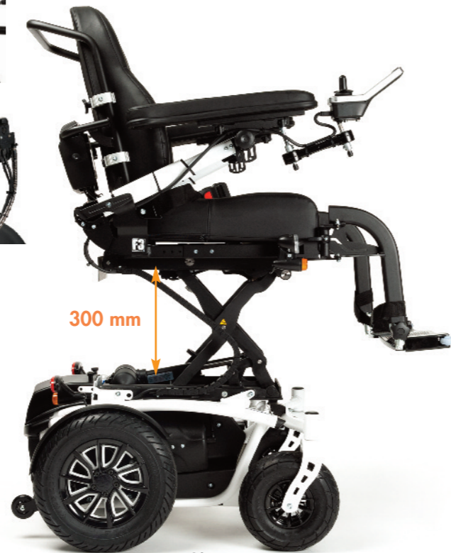
SE42 - lift