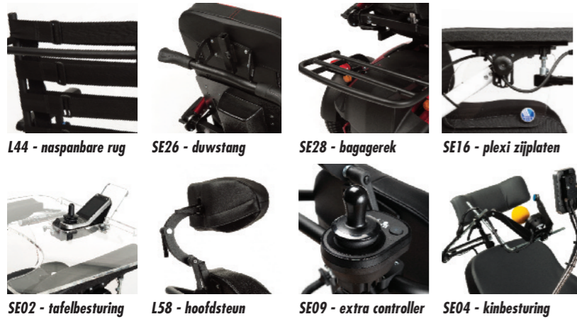
L44 - naspanbare rug SE26 - duwstang SE28 - bagagerek SE16 - plexi zijplaten SE02 - tafelbesturing L58 - hoofdsteen SE09 - extra controller SE04 - kinbesturing

Dit is slechts een klein fragment van al onze mogelijke opties. Contacteer onze vertegenwoordigers voor extra mogelijkheden.